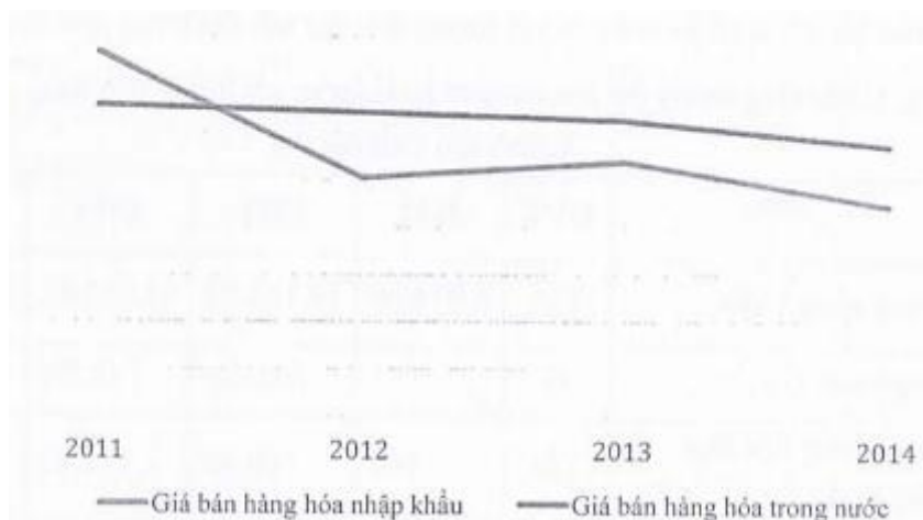
Biểu đồ 2: So sánh giá bán của hàng hóa trong nước và hàng hóa nhập khẩu trong giai đoạn 2011-2014

Nguồn: Tổng cục Hải quan và tổng hợp bản trả lời câu hỏi của các nhà sản xuất trong nước, các nhà nhập khẩu.